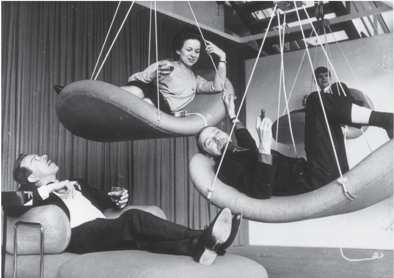
Verner Panton (à droite) en 1963, couché dans l'une de ses «Flying chairs», ces fauteuils suspendus créés pour permettre de faire le ménage sans être gêné par les pieds du mobilier.

Ses premières créations majeures disent déjà cette volonté de marquer sa différence. En 1958, il dessine la Cone Chair pour meubler la maison de vacances de son père. Rapidement, il en propose une version en forme de cœur, produite pour le restaurant Kom Igen («reviens» en danois) de Copenhague, qui devient immédiatement la star des magazines de décoration. Pièce géométrique et sculpturale, elle s'affranchit de sa logique d'usage. Alors oui, certes, cela reste un fauteuil, mais c'est peut-être aussi une œuvre d'art.