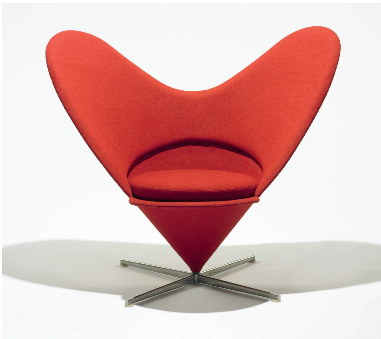
La version en forme de cœur de la «Cone Chair» dessinée en 1958.

bon goût fonctionnel que Panton aborde parfois, mais de manière marginale. Lui, laisse l'idéologie à ses confrères transalpins. Son utopie passe d'abord par les sens, notamment visuel, et la couleur.