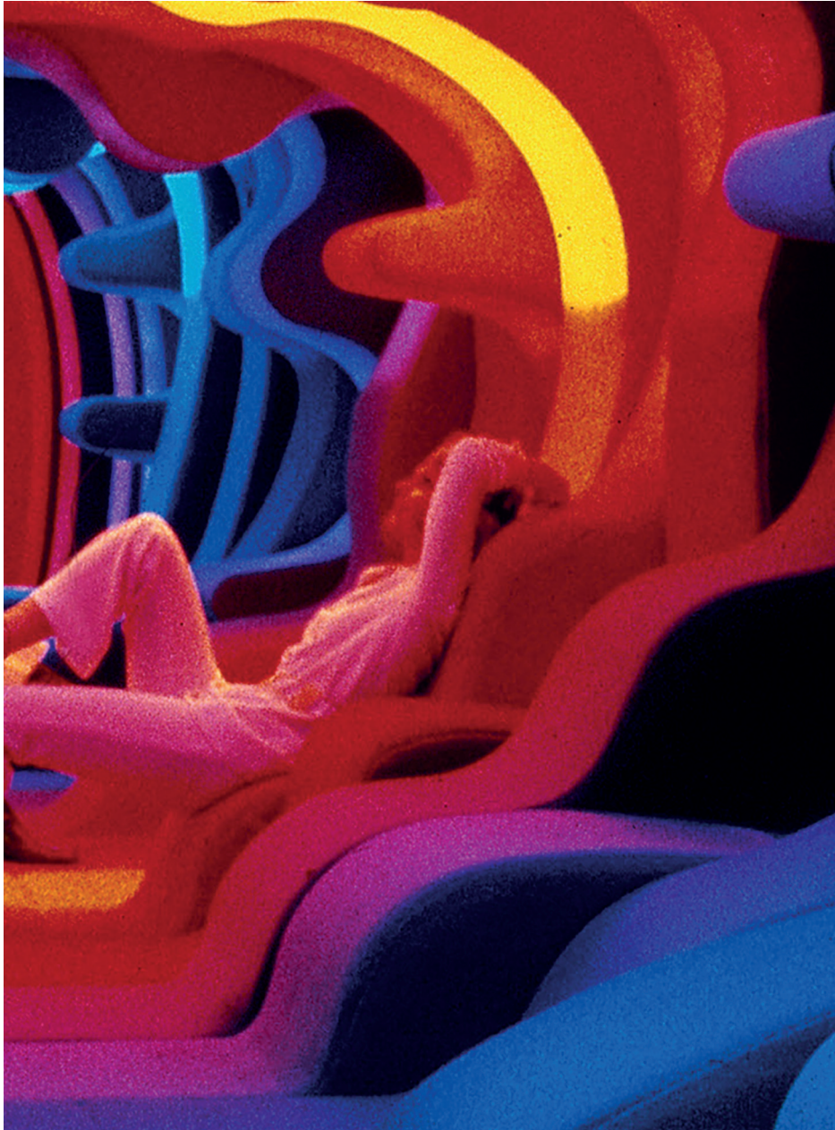
«Visiona II». En 1970, Verner Panton présente un environnement où le mobilier constitue une sorte de paysage apaisant qui pousse les visiteurs à adopter de nouvelles positions. (Verner Panton Design AG)