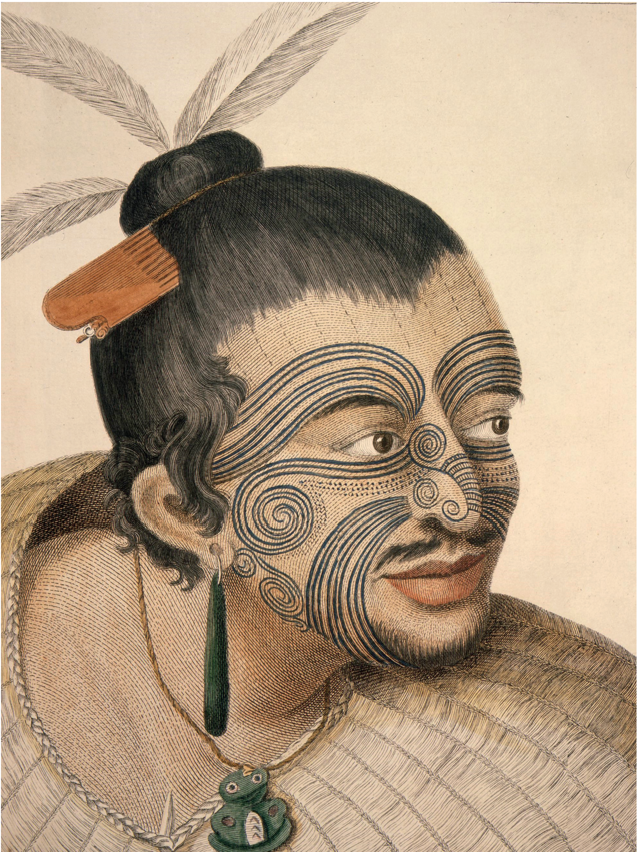
Gravure de 1773 représentant un chef maori recouvert de tatouage tā moko.