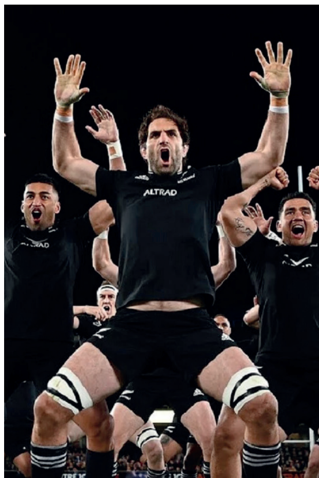
Le musicien hawaïen Arthur Lyman, inventeur de l'exotica, et le haka des All Blacks.

l'image tiki intéressante au-delà du kitsch : elle montre à quel point les îles fascinent lorsqu'elles sont réduites à l'image d'un paradis consommable.