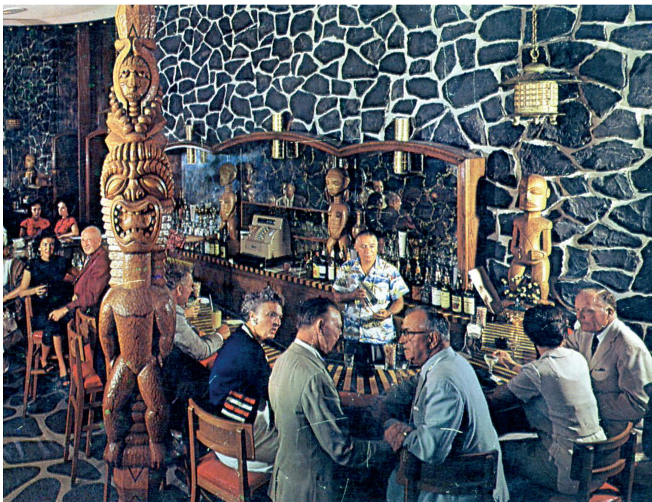
L'intérieur du Kon Tiki Bar en Floride dans les années 50 et son décor inspiré des îles du Pacifique Sud.